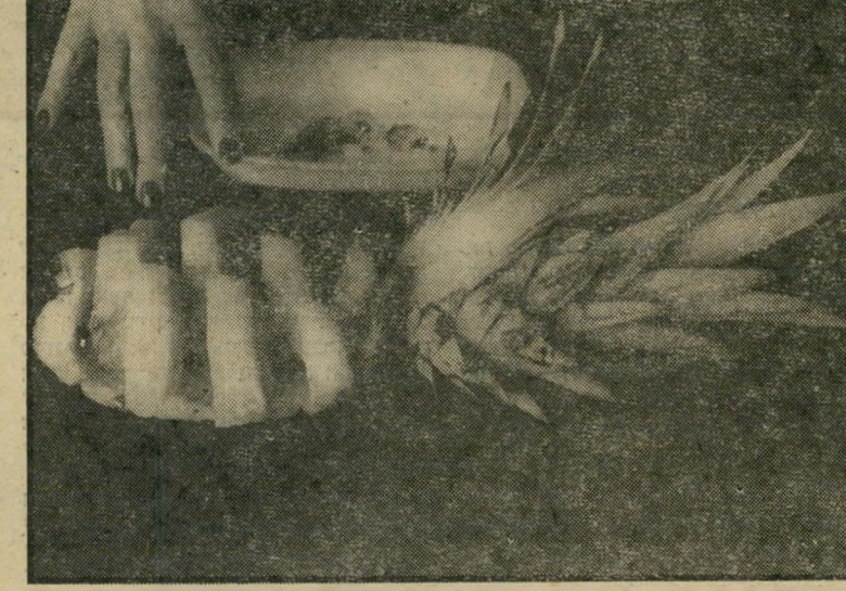
כך מגישים אונס ניפוח אופטי יפהפה

פתאום, בכל החנויות, הופיע אונס גדול. שמן וריחני. מוכרים את זה בעד מאתיים לירות, של יוקרה, ואין מה לעי שות כי הוא טעים. בתחנה המרכזית, קצת מצ'וקמק יותר — עולה רק 7 שקל לים. ישנה אבל רק בעייה קטנה. איך אוכלים את זה לעזאזל?