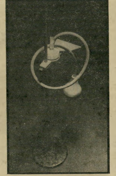
איפה ההכפנה נגד פיצוצים בגומי

היה נעול, לפי ההיכרות הראשונה. כך מצוי הוא בקופסה, כך צריך להיות. חוק זה, על הקליפה ישנם קוצים זעוריים, הנדבקים אל הסכין, הנדבקים לפרי וה" עוקצים בסוף את הלשון. צריך להיזהר לשתוף סכין אם היא נגעה כבר בקליפה. אז זה מה שחשבתי כל הזמן, עד שי ביקרתי פעם ראשונה בארץ הפרנצוים. תפסתי שם פטנט מרהיב, עשוי בשתי דקות, מרשים יותר ממוס בלהכות, איך מגישים אותו.