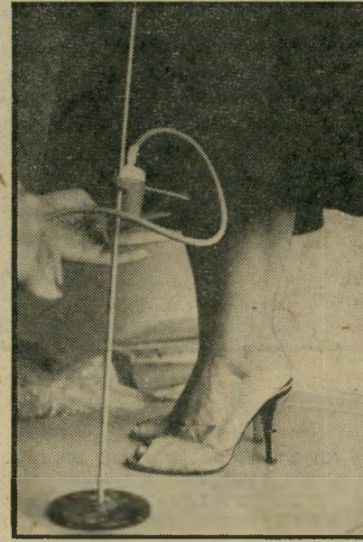
כך מסמנים מכפדות ביטולות

הצאית קלוש לא תיתכן בלעדיו. גם בית עם בנות מתבגרות לא יתכן בלעדיו, העסק הזה שיגעון. אחרי שגומרים לסמן ישראל ומדוייק תוך שתי דקות בלי שום גוזמה, לא נפרדים יותר ממנו, לעולם. לפי מיטב ידיעתי, ניתן להשיג אותו אצל ברנמן, בן יהודה 10 (יוצא קרוב מאוד לאלנבי) טלפון 297660. הוא מייבא אותו באופן אישי מחברת טולינגן הגרמנית. אם יש לכם קשרים בחו"ל, זו המתנה. כדאי לקנות את המכשיר הקטן ביותר, שעמוד המתכת שלו הוא חצי מטר בלבד, ועולה 65 שקל. מניסיוני, לשימוש ביתי זה מספיק בהחלט. אתאר את העסק, והכל יהיה ברור יותר. המכשיר מורכב מדיסקית מתכת עגולה, שהיא הבסיס, שאליה מתברג מוט מתכת בעל שני פרקים, מתברגים אף הם. יש כאן חיסרון, שהברגת המוט אל הדיסקית — נפתחת כל הזמן. אז צריך לדאוג לוודא לפני כל שימוש, שזה אכן מוברג ומחוקק חזק בפנים, ולא זו. זה הכל. על המוט הזה, לאורכו, מטיילת בעזרת בורג שיחזור הרפיייה, כוסית קטנה מלאה אבקת גיר, עם פייה צרה וקטנוחה. מיקום הכוסית על המוט הוא קו המכפלת שישומן, לכוסית מחובר צינור גומי עם פומפה כזאת, וכל לחיצה עליה משחררת מהפייה