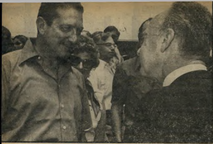
עם רבין הידברות לשם גישוש