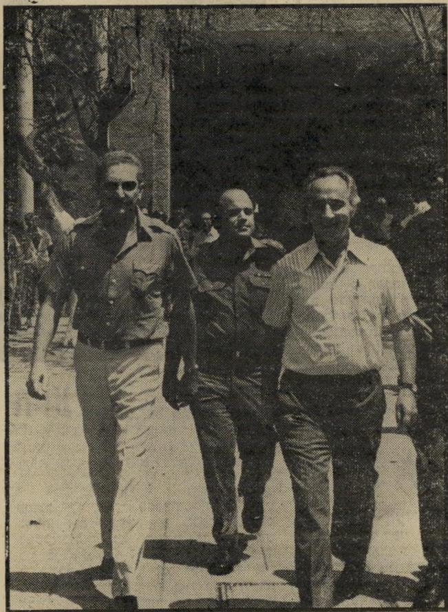
עם פרס הצעה המפתה

האפשרות הראשונה נר-תית, אית, ברגע זה, כחסרת כל