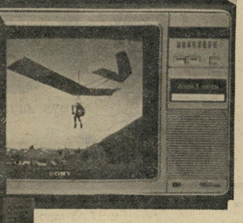
לבחירתך מספר דגמים חדישים בגדלים שונים: