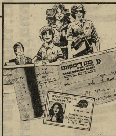
חסכון עו"ש צעיר לבני 16-18

תוכנית חסכון עדיפה לילדים ולנוער. * מבצעים, ספרים ומתנות חינוכיות. * הצמדה למדד – לסכומים שמעל 20 שקל. * מנוי על עתון הילדים "פילון" – בחצי המחיר.