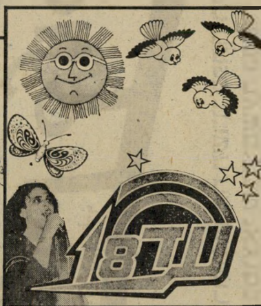
„עד 18“ חוג הצעירים בבנק דיסקונט. לבני 10-18

תוכנית החסכון לצעירים. * הצמדה מלאה לקרן ולריבית. * תקופת חסכון גמישה (4-7 שנים). * אפשרות לפדות את סכום החסכון בשיעורין. * חברות ב"עד 18" – חוג הצעירים בבנק דיסקונט.