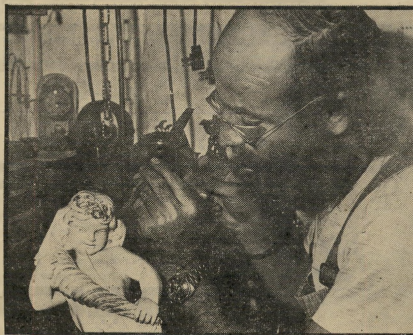
אמן כהן בעבודה חותך, רוקע ויוצר

עקי ינני תחום העיסוק חוזר ונישנה אצל עקי לכל אורך 29 שנותיו. כך קרה כשעסק בגילוף בעץ של דמויות וחיות, או כשהיה הראשון בארץ שיצר ארנקים ותיקים מעור בסיגנון אינדיאני, עיסוק שאותו רכש בעת שהותו בכפרי האינדיאנים בדרום-אמריקה ובמרכזה. רבים מהסטודנטים באוניברסיטת תל-אביב זוכרים את דמותו של המזוקן שגיי צב בשער הכניסה לקמפוס, והציג למכירי רה מבחר מרהיב של עבודות בעור. ברגע שהעניין הפך מיסחרי, עקב החיקויים הרבים — שינה כיוון. עקי נולד בתורכיה, גדל ביוון ועלה לארץ ב-1960. ילדותו עברה עליו באפקה. מ-1972 ועד היום נסע 17 פעם לחו"ל, דבר המעיד על רוחו הסוערת, אהבת