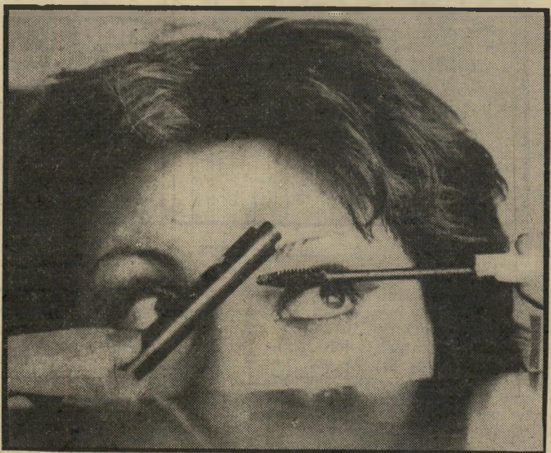
מוצר יוקרה פריסאי ועוד חסר בשוק!

תנו לי רבותי, רק סיפורים כאלה. על הסחורה הזו, אני חולה. כמה יכולה לעלות מסקרה לריסים?