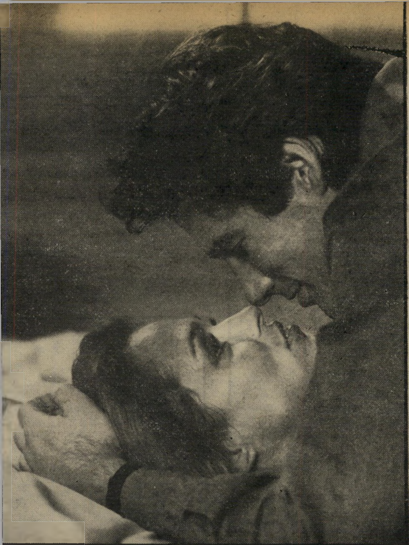
גיר וזרון האטון ב"ג'יגולו אמריקאי" ירחון אופנה מהלך

מות מאשר לשחק את עצמי. אני חושב שהרצון להיות בדמיון עשה אותי לשחקן. היום, אני מצליח ביתר קלות להיות אני עצמי ואני מרגיש בנוח עם עצמי." השוואה נוספת שהוא עורך לעצמו עם עצמו מעידה על התבגרות נוספת: "בתחילת לה רציתי לעבוד, לא חשוב על מה, הערי קר לשחק. היום אני מרגיש אחריות לי- מסר שאני מעביר בסרטים שלי. לחשוב שאנשים עשויים לבוא לראות סרט כי שמי מופיע בו, זה בשבילי אחריות מ- מדרגה ראשונה."