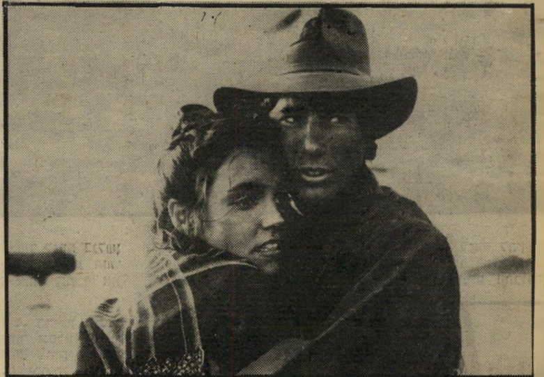
גיר זכרוק אדמס כנאהבים חפרי כז, ב"ימים ברקיע" פועל בעל חלומות

על אהבה שאינה יודעת גבולות לאהוב. גיר, שנולד בפילדלפיה להורים ממוצא אנגלי-אירי, הוא בסך הכל בן שלושים. הקאריירה שלו החלה במישחק בבית הספר ובעיקר בנגינה בחצוצרה. אחר-כך איחד את כישורן המישחק המוסיקה וכתב מחזה מוסיקלי, שבו הופיע לפי וול פונה בתיאטרון בטיאסל. ואז החל להקים להקה מוסיקלית שלא עלתה יפה. הוא פנה לגרינק' וילג' והיפס מזלו במחזות שונים שהופקו באוף ברודוויי. התפקיד הראשון שבו זכה היה כדני זוקו. תפקידו של טראולטה בקולנוע, בגרין שהועלה אז בברודוויי, ואז עבר לשחק אותו בצוות שהעלה אותו בלונדון. מכאן עבר להר פיע בתיאטרון יאנג ויק בהפקה חדשה של אילוף הסוררת והיה האמריקאי הראשון