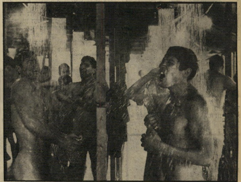
גיר כחייז אמריקאי בכריטיניה, ב"ינקים" חייל בעל חלומות