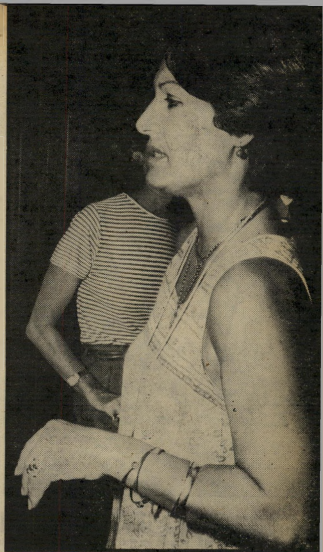
הנשיאה שרה סלע, רעייתו של נשיא מכון וייצמן, פרוי פסור מיכאל סלע, היתה כהרגלה מארחת למופת. היא הביאה את המגשים עם האוכל בעצמה, הורידה את הצלחות המלוכלכות ועם כל מנה שהביאה הודיעה ממה היא עשויה.