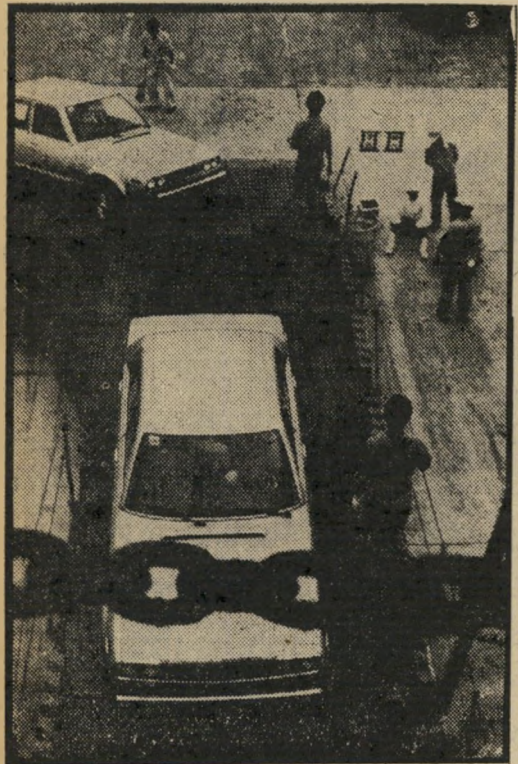
בית-חרושת יפאני למכוניות פחות עשר שנות-חיים

כתב צרפתי שסיקר את מערכת הבחירות בגרמניה, שבה גברה הקואליציה הסוציאלי-דמוקרטית-ליברלית על