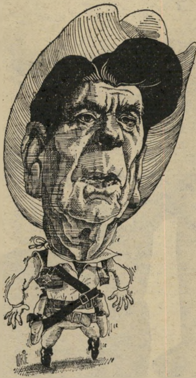
מועמד רפובליקאי רגן גיבור ווטרגייט מסייע

האם מותר לגימי קארטר לקרוא ליריבו רון נאלדן „מחרחר מילחמה“? יועציו של הנשיא נחרדו מהתגובה הקשה על התקפותיו של קארטר על רגן, בעת מסע-הבחירות של הנשיא בקליפורניה. „בורר שגימי צודק“, אמר אחד מיועציו הבכירים של הנשיא, „אבל כינויים