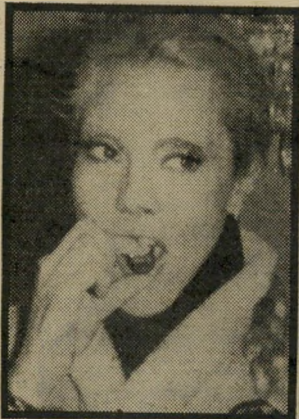
סילבי וורטן מי היא מי?