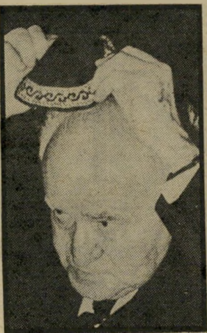
דויד בן-גוריון מה הוא מה?

הרשו נא לי לתקן לגבי בן-גוריון יון: הוא שאף לחברה חילונית וזו ודאי היתה אמונתו הפנימית (מעבר לפוליטיקה ה"דתית" שנקלע