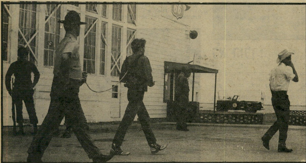
המישרה לוכדת את הגיבור (מרטין שין) בסוף "שבעל הזעם" אחד הסרטים החשובים של אמריקה

כמו צייד הצבאים מתאר הסרט את ער-כיה של אמריקה הישנה כפי שהם משתק-פים בעיניה של אמריקה הצעירה. כמו הם חיים בליה הוא מצביע על בדירות הנעורים ו כמו בוני וקלייד הוא חושף את האלימות החבויה בחברה האמריקאית.