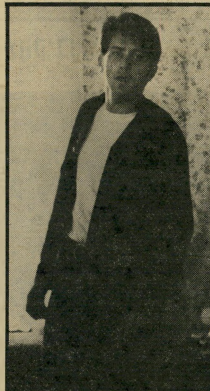
שחקן מרטין שין בתפקיד קיט שביל של גוויות

מאליק נדד עם צוות עובדיו במשך חודי-שיים, והחליף שלושה צלמים תוך כדי ההפקה. הציוד שלו עלה באש, העובדים נפגעו בתאונות, ואחד מהם אף נפצע קשה. לדבריו צילמו פעמים רבות בלי