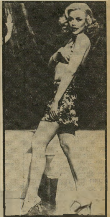
בתפקיד "פזים דיקסון" מתפשטת

סידרת רציחות. שביל הזעם מבוסס על פרשה אמיתית: סידרת רציחות של ברנש תמהוני בשם צ'ארלס סטירקוותר וידידתו ארוליאן פוגייט, שנודו על פני מרחביה הריקים של אמריקה התיכונה והותירו אחריהם שורה של גוויות.