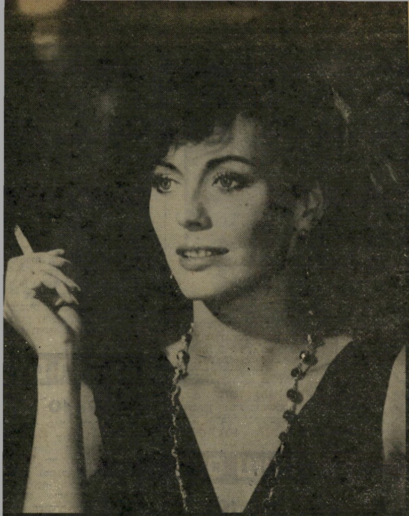
לסלן אן דאון בתפקיד ג'וליאן ברומלי ב"יהלומים עם כל דבר" גונבת

מיסיקה בדי בשר. אם כי באדונים ומשרתים של הטלוויזיה הפגינה זו בקיר אות רבה בגיוון האצילי, לא זורם דם אצילים בעורקיה. אין לה כל יחסין, מילי בד העובדה שבגיל 14 ברחא מן הבית וניסתה להתפרנס בכוחות עצמה. אולי משום כך היה משוך עליה דוק של ליגי לוג, כשעיצבה דמות של לידי מושחתת, כמה היתה נהנית לויף את דמות הלידי. בדמות זו הופיעה בבטסי, כשגילמה גברת מן החברה הגבוהה האוהבת לרדת לתנור חה מאוונט עם כל דיכפין, על להטוטים אחרים של העמדת־פנים חזרה בשוד הרכבת הגדול, כשותפתו הממולחת של שון קונרי. כל התפקידים האלה נראים כתר־גילייכנה לקראת התפקיד הבשל באמת של גיליאן ברומלי, בסרט האחרון יהלום מים עם כל דבר, כאן ניתנה לה ההזדמנות להפגין את מעלותיה האסתטיות הנדיבות ואת חוש ההומור שלה. היא בתו