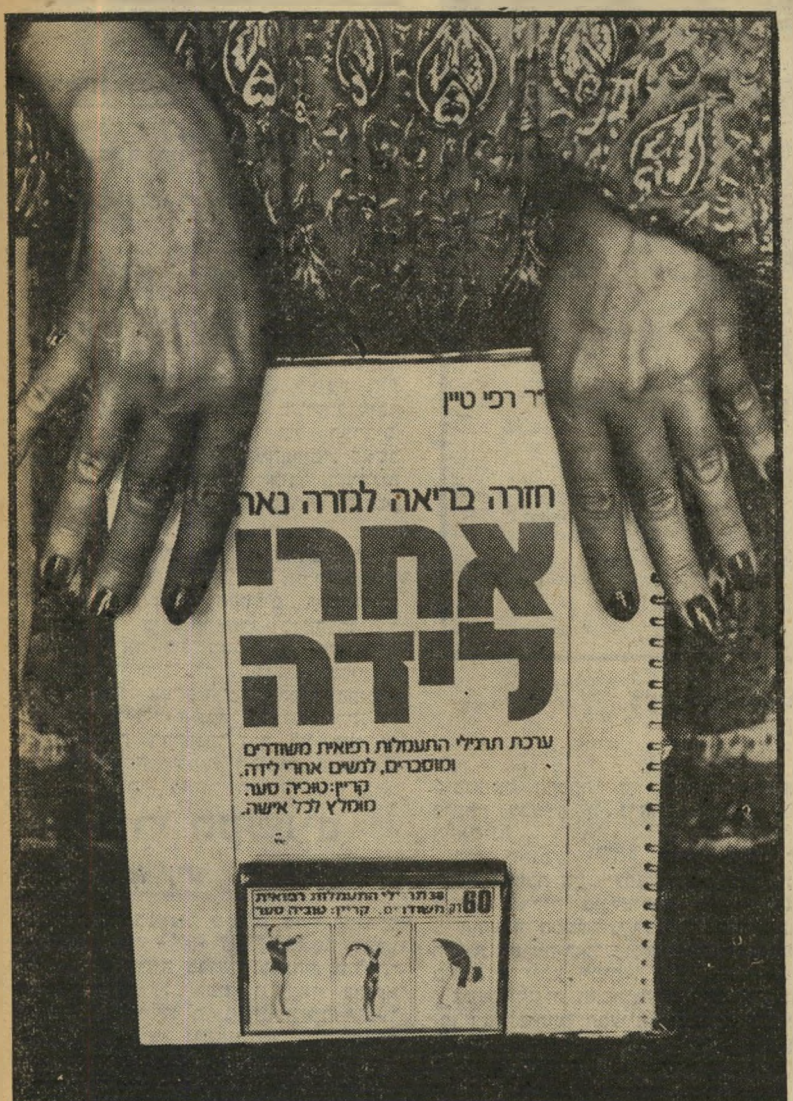
קסטה עם חוברת מהודרת יעיל גם לגברים