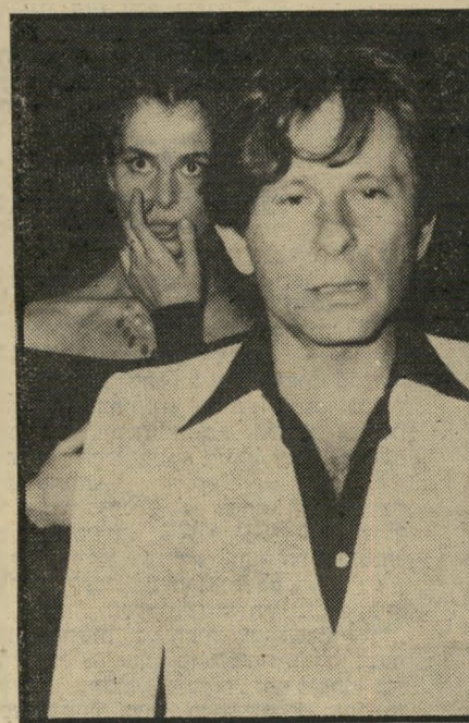
רומן פולנסקי עסקי החתיכות

הבמאי המפורסם רומן פולנסקי, ושחקן הקולנוע רוברט דה נירו, בילו חופשה פרטית באילת. טוב, אילת, זה היה רפי גלסון. הכפר המה מאנשים. בחג, זה פחד אלוהים. איש אחד מצא שם חזיה, מבגדיים של בת-חמש.