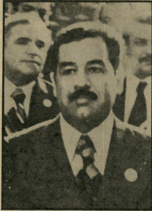
שריט עיראק סאדאם חוסיין כישלון סובייטי נוסף

עיראק, כמו ניגריה, הופכת מעצמה בינונית, המקיימת שיתוף-פעולה זהיר עם האמריקאים אך בעת ובעונה אחת מקדמת את מטרותיה הלאומיות והמרחביות. התפתחות כזו מגדמת את הסכמי קמפ-דייוויד, המטורפים ממילא, והשלכותיה על ישראל לטווח ארוך יחזקו מעבר לשימחה לאיד" פרימיטיבית של עורך עיתון זה או אחר.