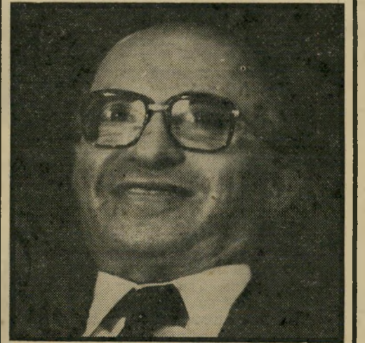
ראש-ממשלה בגין תומך בהיטלר האסייני