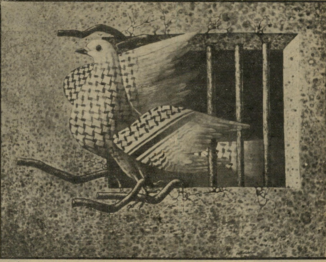
הציור המוחרם של סולימאן מנצור