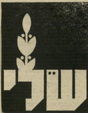
סמל ש' — למען הבטחון

קריאתו של רפול. בין המסתייגים הרבים מיוזמתו של הרמטכ"ל בל" ט אנשי מחנה-השלום של של"י. חרב ועלה זירת. כרגיל במי קרים כאלה הוקם ועד ציבורי, כדי לחפות על הכישלון. הוא נקרא הוועד הציבורי למען ביטחון יש" ראל — הקרן להתעצמות צה"ל. הוועד גייס לשורותיו כמה אישי ציבור שכוחים, והחל לפרסם מר דעות ענק בעיתונים, שמחירם יקר. כדי להתאים עצמם לרוח הזמן סברו מנהלי הוועד, שיש להנהיג סמל נאה למיבצע ההתרמות. ר אמנם, מבין כל ההצעות שהוגשו להם בחרו את זו שבראתה המת אימה ביותר. היא כללה את ראשי התיבות של הסיסמה, "למען ביטחון חון ישראל". היוצרים את המילה הקצרה "לב", ואת החרב ועלה הזית שאותם ירש צה"ל מן ההגנה. כשהופיעה הסמל על גבי המר דעות הגדולות של הוועד, הופתעו רבים לגלות כי הוא דומה. משום מה. לסימלה של של"י (ראשי התיבות של "שלום לישראל, שיו" יון לישראל"). שהיתה מראשונה ה מתנגדים לסריק של הרמטכ"ל (ראה ציורים).