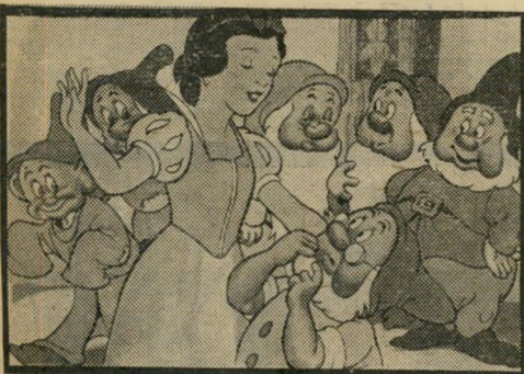
שגייה והגמדים לתאצ'ר מספיק שניים

למדיניותה האולטרה-שמרנית של ראש ממשלת בריטניה, מרגרט תאצ'ר (העולם הזה 2246) יש גם חוצאות משעשעות. השבוע נאלצה עיריית וולוור-המפטון, בלב האיזור התעשייתי של אנגליה, לקצץ