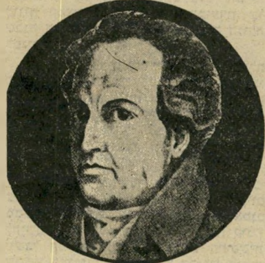
יוהאן וולפנגג גתה אחת היצירות הסתומות ביותר

"ההצגה נמשכה זמן רב. ברברה הוקנה היתה נגשת מדי פעם אל החלון, ממה אוזן שמא כבר נשמע שיקשוק מרכבות. מצפה היתה לשובה של מריאנה, גברתה היפה, אשר הקסימה אותה לילה את קהל הצופים בהופיעה בלבוש קצין צעיר, כי קטע הסיום שלאחר המחזה. הערב היתה ציפייתה של ברברה מתוחה במיוחד, שכן בנוסף לארוחה הקלה שהכינה ל"