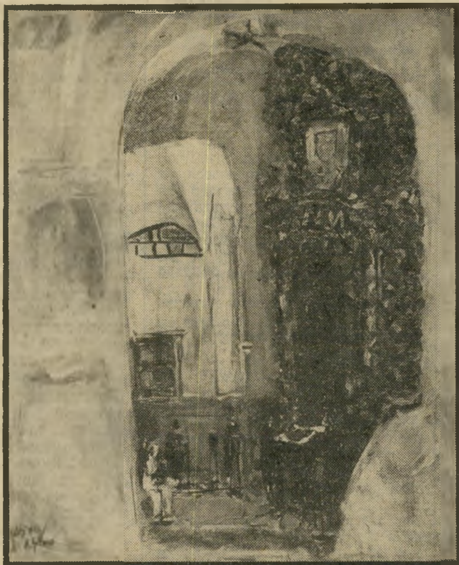
ציור המיתולוגיה הישראלית (שר גולומב) של נחום גוטמן