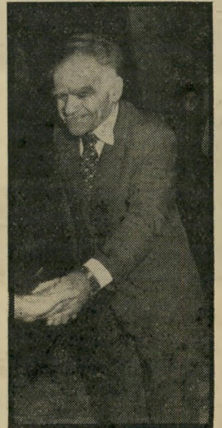
יצחק שמיר חידו משופע הבטחות

מזל מאזנים - מזל אינטלק-טואלי כיתר מזלות האוויר, ו-