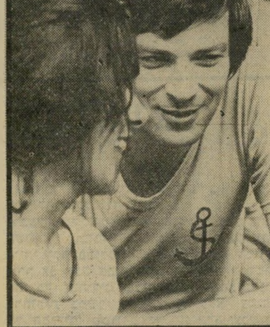
לדנים וזהר ואיינשטיין שידור חזר

באחת מהתוכניות הקרובות של שיחה בשניים עומדת אישיות ישראלית ראשו נהיבמעלה להתוודות על נושא חסרתי-קיים דים בתולדות הווידויים הפומביים בארץ. עורך התוכנית, ישראל ויבר, שומר כסוד כמות את הווידוי ואת גיבורו