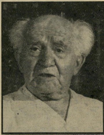
בן-גוריון אינו אוהב פקודות

דברים אלה מוציאים אותם מהאזינון לו הם זקוקים, ואף גורמים להם לדיכאונות ורפיון ידים, או חוסר יכולת לתפקד. מאזניים — המזל השולט על ההרמוני-