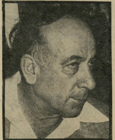
יגאל הורביץ מסוגל להתווכח על כל דבר

שני הצדדים היא בעוכריהם, בגלל תכונה זו אינם מסוגלים להחליט, הם פוסחים על שתי הסעיפים, ומתענים עד שמגיעים להחלטה כלשהי. גם לאחר ההחלטה אינם בטוחים שאכן זו ההחלטה הנכונה. על-פירוב הם מנסים להתייעץ עם כל אחד, אנשים בעלי אישיות חזקה מסוגלים להשמיע עליהם לנהוג בצורה זו או אחרת, אם יתנו להם את ההרגשה שבכל זאת הם (המאזניים) הקובעים. הם אינם אוהבים פקודות, כפייה או