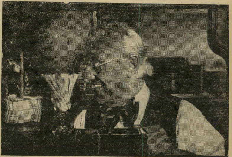
עדה עדה קרחה ורד שיער

סוף היה לו לא נעים, הסכים לומר הכל, כמה איפה מי ואיך, או ככה, זה ניתוח פלסטי חכם מאין כמוהו. הרבה יותר חדיש מהשתלת שיער בנקודות קטנות שכואבות חוק, זו למעשה המילה האחרונה בעיסקי הקרחות. זה לא מתאים לכל קרחה, ביחוד אם נשאר לו זר כומר קתולי קט מסביב הראש. זה כן מתאים לכל זכר שהשיער נטש אותו, רק עד הקדקוד, צריך סחורה עצמית להתרמות, כמה שיותר — כמה יותר טוב.