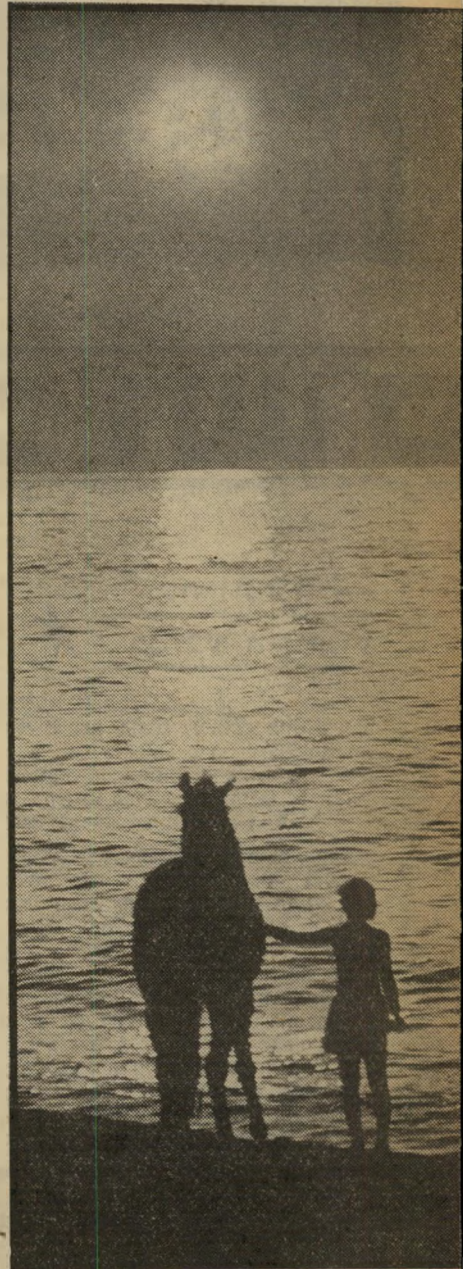
הספיה השחור היפהפה

ידיד אמריקאי, הסרט הראשון של הר במאי וים ונדרס, המופץ מיסחרית בישראל, חשף בפני הצופה הישראלי את הר אסכולה של מעריצי הקולנוע האמריקאי באירופה. אלה משלבים בנוסחות של סרט הפשע הקלאסי את אותם היריהורים על מוסריות, צדק והשפעה הרדית בין תרבויות