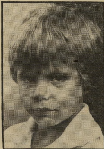
ידי-פלא ג'פֿטין הנרי החמוד

תרגילים בהתבוננות, סרט צנוע אחר על ארבעה צעירים בעירה אוניברסיטאית במרכז ארצות-הברית, היווה את אחת הר הפתעות של השנה. לא היו בו כוכבים ולא