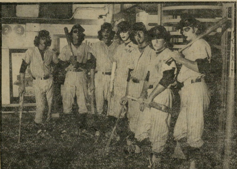
2. חבורת הלוחמים (ארצות-הברית)