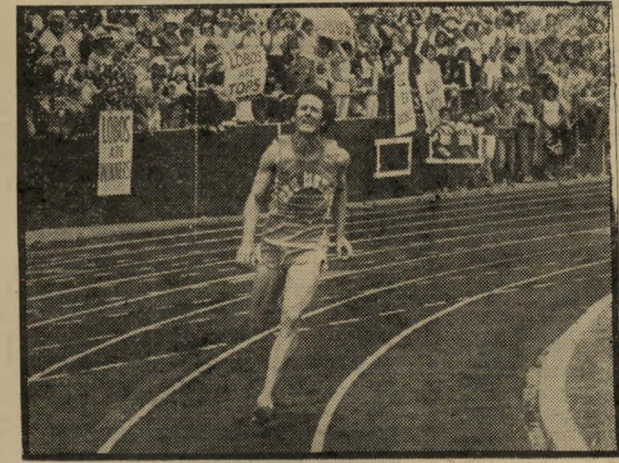
בוטומס: עונה מזהירה

כועות (11.15). פרק 66 בסידרה. עוד התפתחויות ברומן של ג'סיקה הפסיכיאטר פונגר.