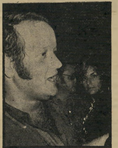
מנהל-קודם שילון מחלקה הרוסה?

היתרונות המיקצועיים, שנותרו במחל-קת-החדשות מאז עידן דן שילון, ושל