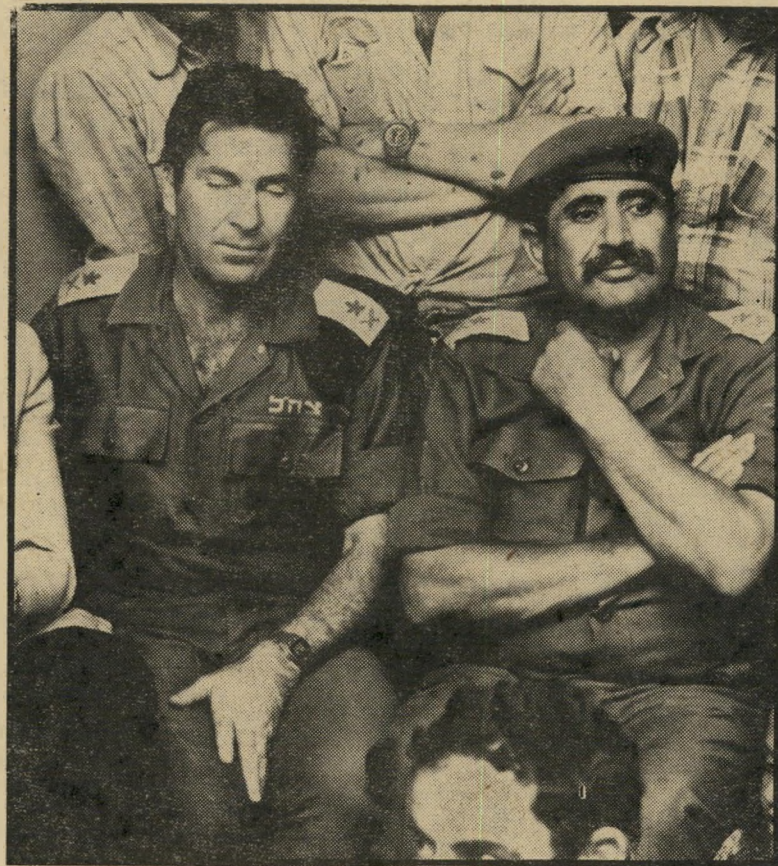
מועמדים אדם ושומרון וחק לעומת אנטבה