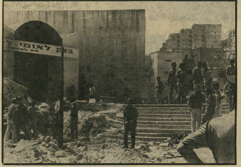
מקום מותה של מלכה מרדו ביקנעם כבדק משמיים כחולים

יתכן כי ההפיכה הצבאית תסיר לפחות זמנית — את הסכנה של ניתוק היחסים בין ישראל ותורכיה. ה"שאלה היא אם זהו השלב האחרון בהתפתחותה של תורכיה — או ש"גם תחת מעטה הדיקטטורה הצבאית יגבר הזרם הדתי, כפי שקרה באיראן של השאה.