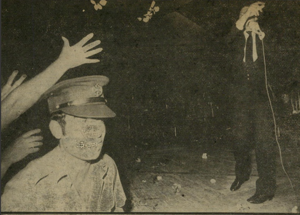
פרחים מעופפים נראו באוויר, מאלס היכל הספרדי חוליו התרבות בתל-אביב, בעת שהזמר הספרדי חוליו איגלסיאס השמיע את שיריו הרומנטיים. הקהל הנלהב זרק לעברו, לאורך כל ההופעה, פרחים רבים. „ההיסטריה של הצופים היתה מעל למה שציפינו.“

„אני רגיל לישון לבד בכל לילה,“ הזהיר הזמר המלוק והיפיוף כל אישה שניגשה אליו כדי להיביט בעיניו מקרוב, ולראות למה בעצם יש לו שם כזה של כובש לבבות משגע. „הוא מרח את השיער הדליל שלו בשומן, הוא הבליט את שיניו התותבות בחיוך מאוון לאוון, הוא לא הסתיר את הכרס הקטנה ש־הוא מגדל, ואני עדיין מתקשה להבין מדוע כל אחת נכנסת ל־היסטריה כשהיא רואה אותו. אבל אולי מרחוק, כשהוא על הבמה לא