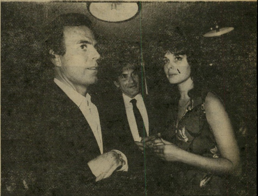
עם מלכת היופי רינה מור, אותה הוא מכיר עוד מניו-יורק. למרות שהתנשק עם כל אשה שניגשה אליו, מוכרת ושאינה את רינה מור, ושוחח עמה באיפוק במשך הערב.