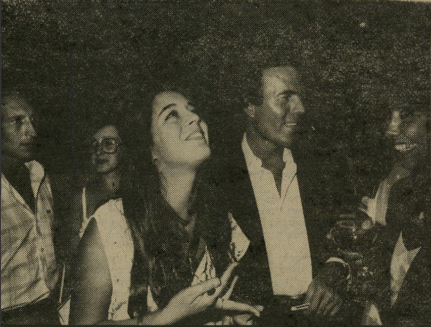
עם השחקנית ענת עצמון (משמאל) ועם הזמרת אביבה פז (מימין) נפגש חוליו בפעם הראשונה בעת המסיבה שנערכה לכבודו. הוא פלרטט עם כל נערה, וניסה את מזלו גם עם ענת, אך ללא הצלחה.