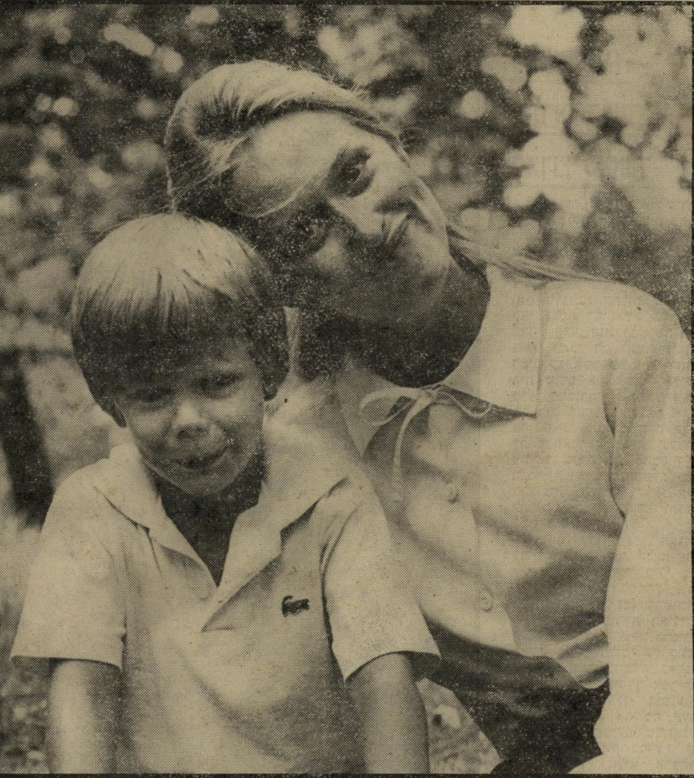
מריל סטריי וג'סטין הנרי: התמונה שלא פורסמה