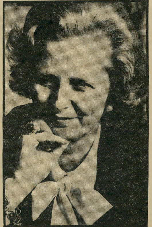
ראש-הממשלה מרגרט תאצ'ר אין לי כסף

יש להם כסף. ההטפה הזו מוכרת לקורא הישר-ראלי, הרגיל לקינות בנוסף "אין לי כסף" הנשמעות מפי אלה שיש להם. באורח אישי הרבה מאוד, תאצ'ר עצמה מגלגלת אמנם את עיניה לשמיים. איש אינו אשם