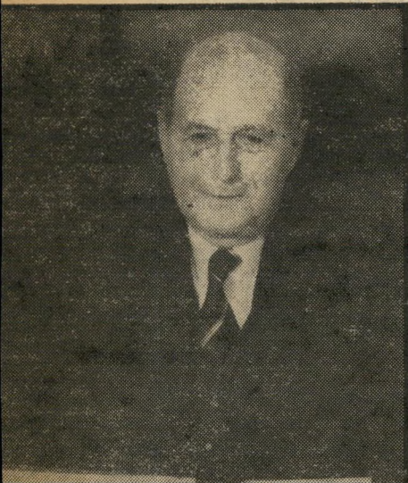
השופט לנדוי על כס המישפט

כאשר הגיע מועד העתירה להתברר, הסתבר כי המדינה כבר פינתה את המקום, בערך ששים יום אחרי הצו הראשון. לכן זכו העותרים בהוצאות מישפט בלבד. החלטתו זו של הבג"ץ — שישב בהרכב הגדול ביותר שלו מועלם, בראשותו של הנשיא משה לנדוי — אשר התייחסה