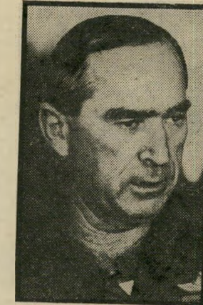
רמטכ"ל איתן לנקות את האוזן

ח"כ מרדכי זירי שובסקי : "אני מכיר גברים שהולכים למיטה עם מצלמה משום שעם אגפא זה מצליח". ח"כ פסח (פייסי) גרופר : "אחרי מה שאריק שרון עשה לחקלאות כבר לא צריך שר חקלאות במדינה". שריהפנים הד"ר יוסף בורג , על הוויכוח בין משה דיין לבין חסן אל-תוהמי: