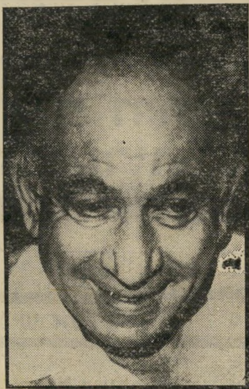
שמר הרוביץ יכולת העדפה

החוק מאפשר ליהלומנים לנהל את ספריהם בדולרים ולא בלירות, ובכך הוא פוטר אותם מתשלום מס-הכנסה על גידול בשווי המלאי, כפי שמשלמים שאר האזרחים. היהלומנים יחוייבו לנהל