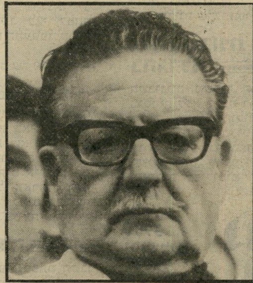
סאלדור אינדה צבא הכיבוש של הסי-איי-איי.

גם בארצות-הברית היתה התגובה דומה. היטיב לאפיין את המערכת שיהפרסם השבוע בניו-יורק טיימס: "השביתה המאסיבית של הפועלים הי-פולנים הזכירה לנו שהפעילות ההירואית והבלתי-אלימה של השובתים היתה נחשבת לבלתי-חור-קית. לפי חוקי העבודה הנהוגים בארצות-הברית, המתון והאינפלציה עלולים לדחוף את הפועלים האמריקאים לצעדים דומים. במקרה כזה כדאי להם ללמוד מעמיתיהם הפולנים פרק בטקטיקה ובנחישות-החלטה."