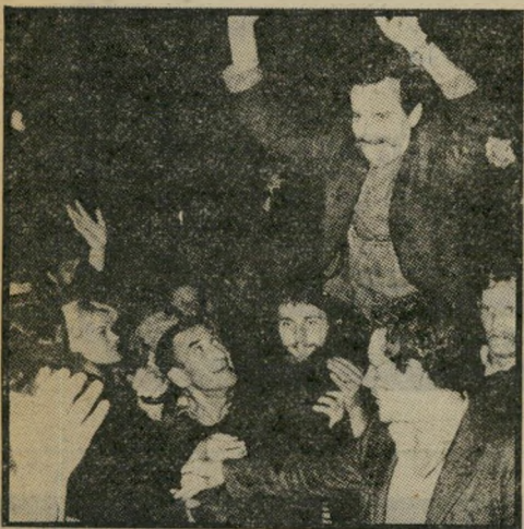
דך ואלסה בתהלוכת הניצחון אסור בארצות-הברית

"כמה מהעיתונאים שלנו ניגמו מסוגלים להגות את המלים אגוד מיקצועי בלי קצף על השפ-תיים", התלוצץ ראש האגף השמאלי במפלגת הלייבור הבריטית, אנתוני וודג'ווד בן, ולפתע נאלצו לכתוב בהתלהבות על מאבקי פועלים. לפרשת פולין היה, כנראה, גם תפקיד חינוכי.