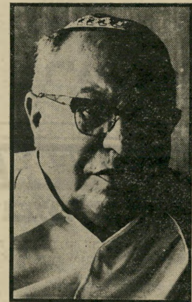
שר הפנים יוסף בורג מה שווה הבטחה של שר?

לגורלם של בתי-הקולנוע. בשבע השנים הטובות שלהם (שנמשכו דרך-אגב הרבה יותר משבע שנים), הם נהגו בקהל ב"גסות, הם הונחתו את אולמותיהם, ולא עלה כלל על דעתם שעליהם להכין קהל של חובבי קולנוע אמיתיים, אשר ישמרו להם אמונים, גם כאשר השנים השמנות יעברו דיאטה של טלוויזיה. אנשי העירייה ממהרים תמיד לשלוף נימוקים אלה בכל פעם שהם ניצבים בפני טענות הציבור.