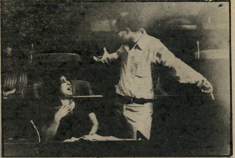
חביבה על: גאולה כהן מתלוצצת במליאת הכנסת עם יוסי שריד (מימין) ועם לובה אליאב, בעת דיון -

מממשלה זו, באוגוסט 1970, ביגלל הסכמת גולדה מאיר לשביתת-הנשק אשר סיימה את מלחמת-ההתשה — הפעם שכללה איזכור של המילה "נסיגה" — נסתם הפער שחצץ בין גאולה כהן ומנחם בגין.