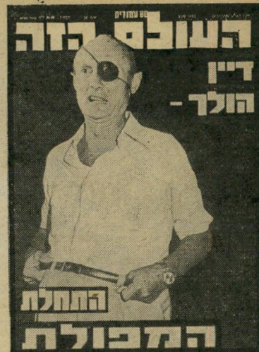
24.10.79 : משה דיין מתפטר במפתיע מתפקידו כשר-החוץ בממשלתו של בגין.