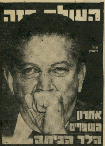
28.5.80 : שר-הביטחון עזר וייצמן מתפטר כמחאה על קיצוץ תקציב-הביטחון.