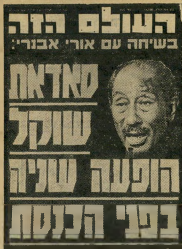
9.4.80 : בשיחה עם אורי אבנרי מודיע הנשיא סאדאת על רצונו לנאום בכנסת.