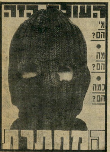
11.6.80 גילוי מחסן חומרי-נפץ בשייבך בעיר העתיקה חושף מחתרת יהודית.