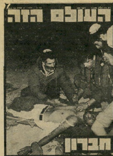
7.5.80 : שישה בחורי-ישיבה נהרגים ממטח-אש בפתח "בית הדסה" בחברון.