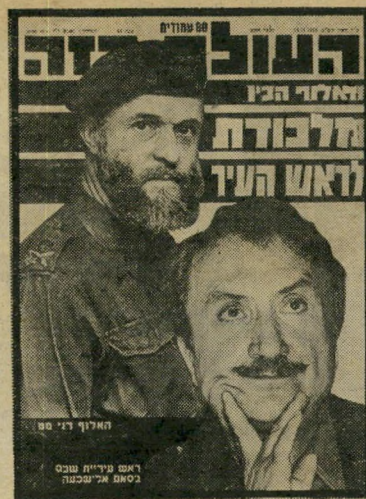
14.11.79 : אחרי שיחה עם האלוף מט, מקבל ראש-עיריית שכם, שכעה, צו גירוש.