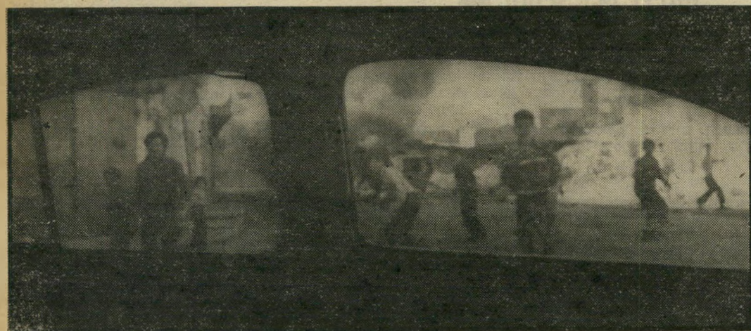
יום אבנים בחלחול: בני העיירה ממטירים אבנים לעבר מכונית ישראלית

במהלך שביתת-רעב של אסירים פוליטיים בכלא חדש, וחמור במיוחד, שהוקם עבורם בנגב, נהרגו שני אסירים בדרך מקרית: הם נחנקו תוך כדי האכלתם בכוח, כשהם כורעים על הארץ. ידעם כפוחות מאחורי גבם וקשורות לרגליהם הכפותות. גם סיפור זה זיעזע את העולם. הידיעות היומיות-כימעט על המתרחש בשטחים המוחזקים מילאו את העיתונות הבינלאומית, יצרן בהדרגה תמונה של ישראל כמוערת, קולוניאלית, מנשלת, מגרשת ומדכאת. ואילו הפעולות הפלסטיניות, גם האכזריות ביותר, נתקבלו בעולם כמילחמת-שיחור לגיטימית של עם הנאנק תחת שליטון-כיבוש. התדמית של הכיבוש הנאור, הליברלי והאינטליגנטי נהרסה ונעלמה לבלי שוב. ממשלת-ישראל, וגם רוב דעת-הקהל הישראלי, התעלמה מההשפעה המצטברת של