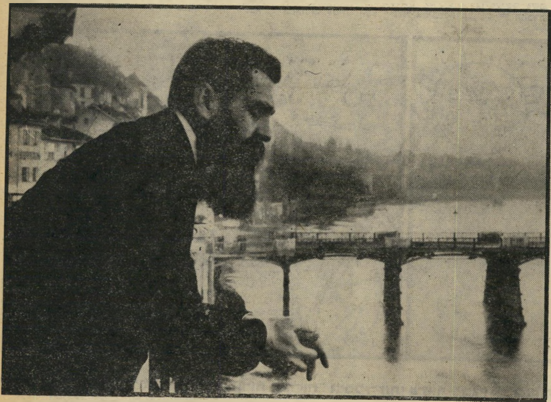
בנימין זאב הרצל בבאול: מראה מעל הגשר על הנהר ריין

הסכמי קמפדייוויד, פריצת-הדרך הגדולה של תש"ס, לא הובילו אז אפי-הדרך, שממנה