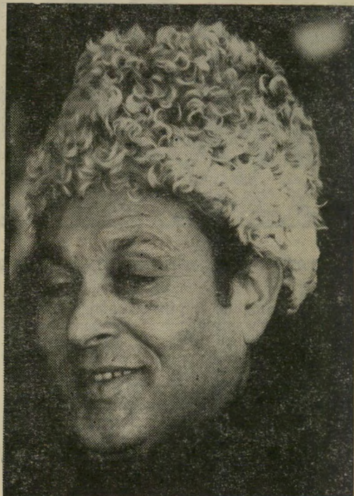
השר מודעי: 90% כישורים

הבריומפלגה, ובלוון המר, גילגל את עיניו כלפי שמיא, כמו נזיר היתולי בסרט איטלקי, כשעה שרמת ההוראה הוסיפה לרדת בכל רחבי המדינה, ואילו מיספר