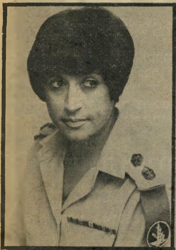
קצינת-חן רז כבוד ואיכפתיות

ציר אלמוני מטבריה, שהתגלה אחר-כך כעבריון, נחשב בעיני הציבור כזה שטבע את הביטוי "העיניים של המדינה", בהתכוונתו לחרמון. אך לאמיתו של דבר היה זה דרורי שהפך את החרמון לדגל ולסמל בגולני. פעמיים במהלך מלחמת-