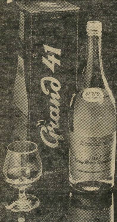
גרנד 41 ברנדי מעולה עם המוטיב והמסורת של ימות אשקלון