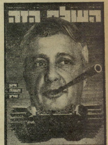
איש השנה תשל"ג מקסייליכוד שרון