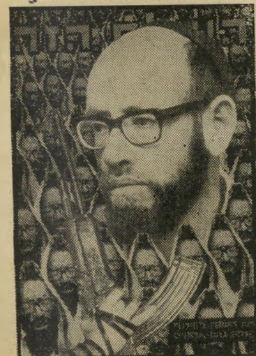
איש השנה תשל"ז מנהיג „גוש אמונים" לווינגר