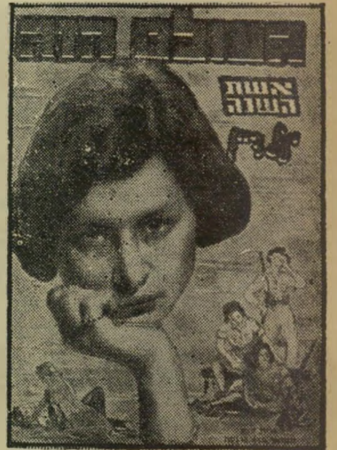
איש השנה תש"ט סופרת דיין