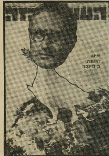
איש השנה תשל"ד מסדר-ביניים קיסנינג'ר