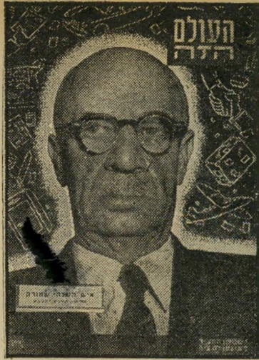
איש השנה תש"ב מבקר-הסוכנות שמוראק