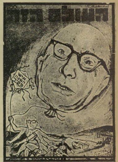
איש השנה תשכ"ז כלכלן ספיר