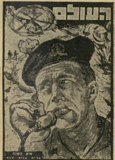
איש השנה תשכ"ח לוחם-בפידאיון רגב