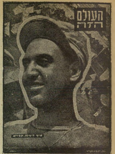
איש השנה תש"א העולה החדש האלמוני