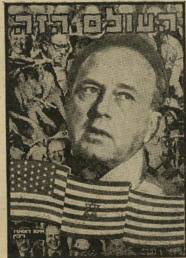
איש השנה תשל"ה ראש-ממשלה רבין