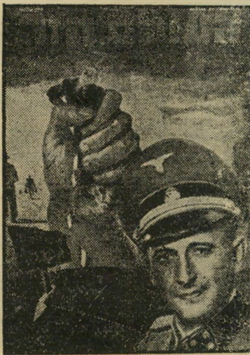
איש השנה תש"ך רכז-שואה אייכמן