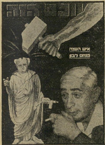
איש השנה תשכ"א מודח לבון