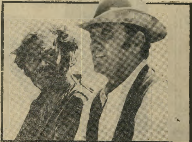
הולדן ובורגנין: הנוקמים שבת, שעה 10.05

● שעה טובה עם מני פאר ואורחיו (9.20). ● אנה קארנינה (10.25) — שידור בצבע. בפרק