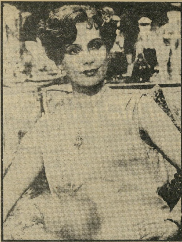
אנים: מדוע לא ביקשו את אוונס? יום חמישי, שעה 10.25

יוצגו מעלליו ומעללי מכשיריו של הרופא, חוקר מקרייהמות.