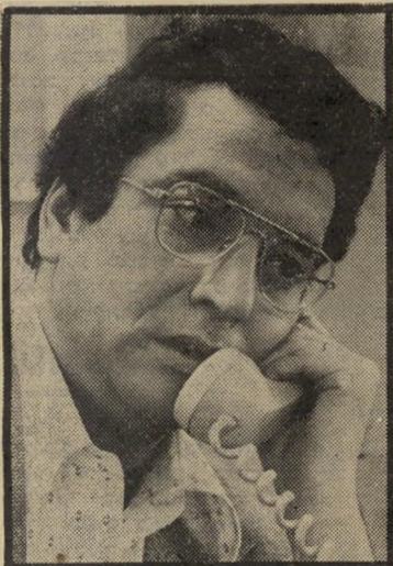
מנהל-מועמד אחימאיר ערוץ לחיים?

דוגמה לכך ניתנה במהלך השבוע של ועידת המפלגה הדמוקרטית בניו-יורק. סיקר אותה שילון. מאחר שרשות השידור נמנית על איגוד השידור האירופי, היה על הטלוויזיה לקבל את כתבותיו של שילון לון דרך האיגוד, שתבע סכום של 2000 דולאר ליום, בתוספת מחיר העברת הכתרים באמצעות הלוויין, בתוספת מחיר ה-ייצור של הכתבות בניו-יורק, אלא ששילון העדיף ליצור קשרים עם אנשי רשת אן-בי-סי, שהעניקו לו אפשרות להעביר