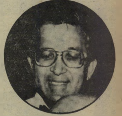
דובר פתיר העיתונאי טעה

כל הנספחים הצבאיים התייצבו לתרגיל, כפי שהם עושים בכל פעם שצה"ל מוזמן אותם, חוץ מארבעה שלא באו. היו אלה אלוף-מישנה טורקא, הנספח הצבאי הצרפתי, אלוף-מישנה גואלי, הי