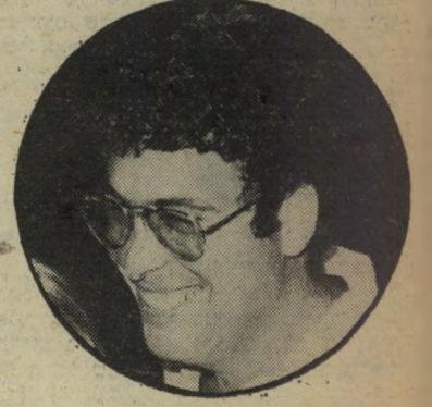
דובר ויינריך הדובר טעה

נספח הצבאי האיטלקי, סגן-אלוף ריכט שטיין, הנספח הצבאי הגרמני ואלוף-מישנה באוצ'ר, הנספח הצבאי הבריטי. לשילטונות צה"ל היה ברור שההעדרות היתה מכוונת. הנספחים הצבאיים של ארצות-אירופה החליטו שלא להשתתף בתרגיל ברמת-הגולן.