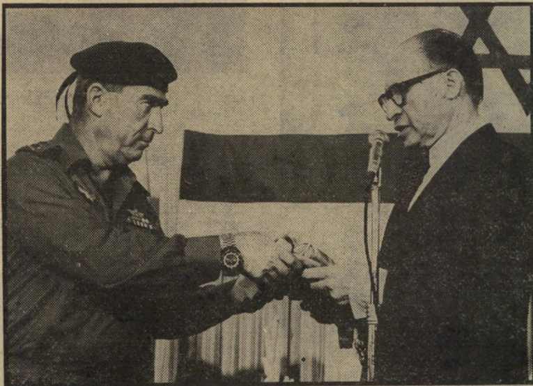
רמטכ"ל איתן ושר הביטחון בגין לברוח מאחריות

אחרי שאבן תאר בהודעה שלו את אשר נאמר בפגישה, הוא הכניס לנספחים הצבאיים מכה מתחת לחגורה: "ה-