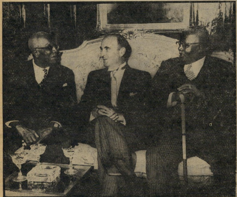
ליבריה אבריאל, לבוש במדים של דיפלומטים, בעת שיחה עם שני שרים בממשלת ליבריה, עת כיהן שם כשגריר. אבריאל היה מבוני יחסי ישראל עם ארצות אפריקה השחורות, והיה מקובל מאוד על מנהיגים אפריקאיים.