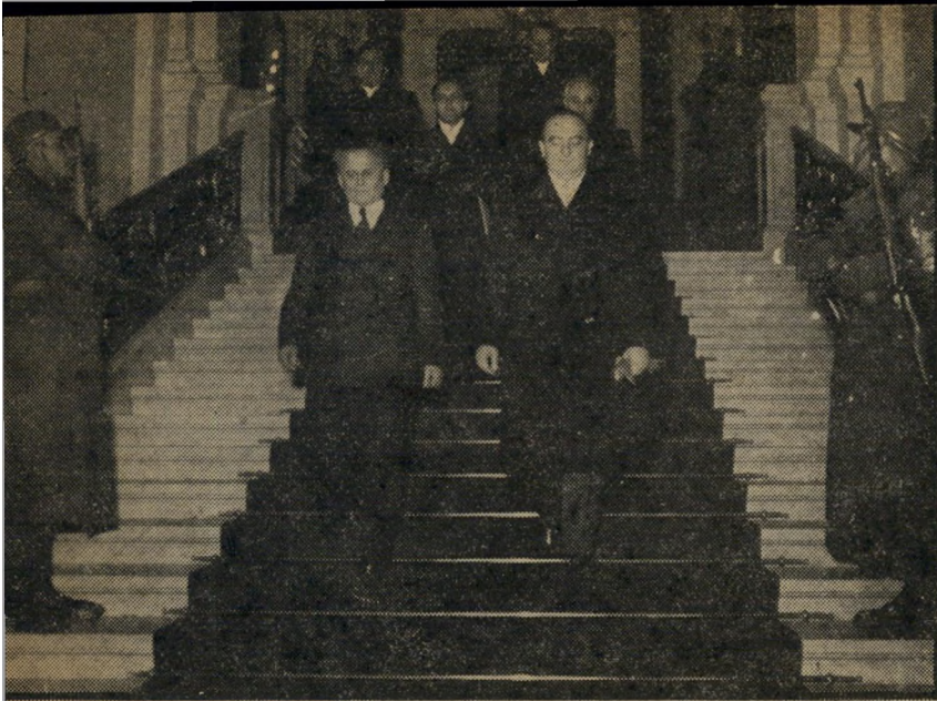
הונגריה כשמונה אבריאל כשגריר הראשון של ישראל בצ'כיה, הוא מונה גם כשגריר הראשון בהונגריה. בתמונה נראה אבריאל בפתח משרד החוץ ההונגרי, בעת הגשת כתב האמנה. לפני כן עסק בפוטולות וכש בריאה.